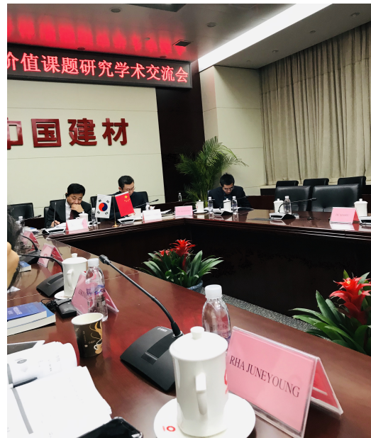
<중국 국유기업 사회적 가치 측정 공동연구 행사(2.25.~2.27.), 중국>