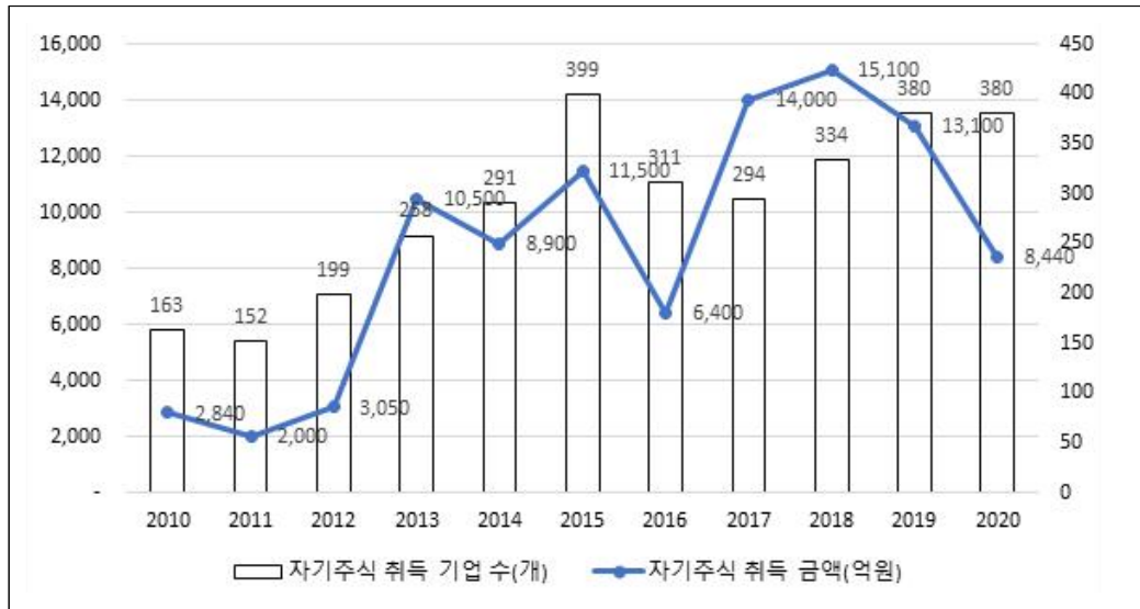
[그림 II-2] 비상장기업 자기주식 취득 거래 연도별 현황

주: 2022년 2월 현재 외부감사 대상 비상장법인의 재무자료 중 자산 수치가 있는 기업을 대상으로 함 자료: KIS-Value, 자본변동표상 자기주식 취득(처분) 자료 이용