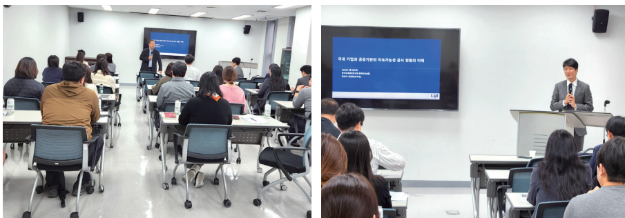
제2차 전문가 세미나 시리즈(2023. 4. 6., 본원 8층 중회의실)