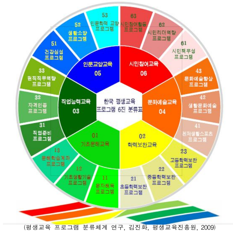
<그림 1> 한국 평생교육프로그램 6진 분류표

○ 즉, 평생교육 프로그램 분류체계를 객관적으로 명확하게 정립한다면 사업 운영·관리 및 성과관리에도 유용할 것이라고 생각함